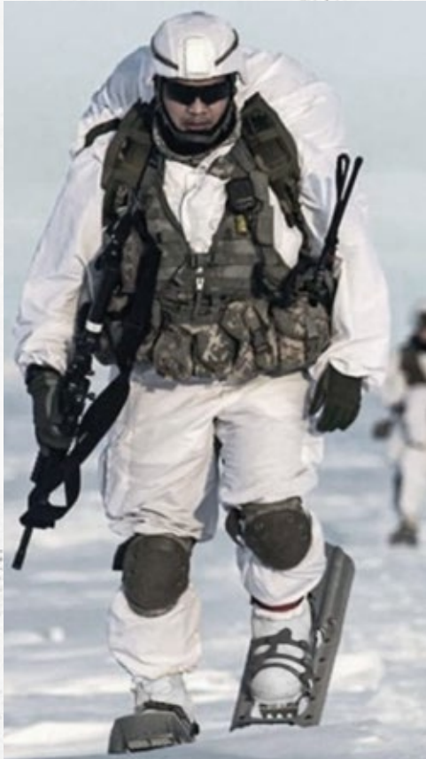
Conçue spécifiquement pour une utilisation militaire dans des environnements de froid extrême.

La « Bunny Boot » est le surnom le plus courant de la botte Extreme Cold Vapor Barrier. Cette grande botte bulbeuse en caoutchouc imperméable peut être portée dans les conditions les plus glaciales, de -29^{\circ}\text{C} à -51^{\circ}\text{C} ( -20^{\circ}\text{F} à -60^{\circ}\text{F} ). L'intérieur sans doublure conserve la chaleur en prenant en sandwich jusqu'à un pouce d'isolation en laine et en feutre entre deux couches de caoutchouc étanches à vide. La conception de la Bunny Boot inclue un système de réglage de la pression d'air qui permet de diminuer la pression en vol et qui permet aussi de vérifier l'étanchéité de la botte.